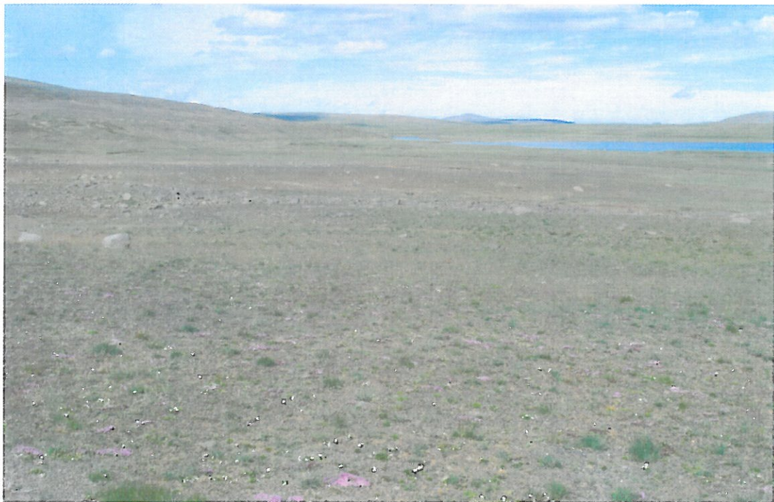
Mynd 2. Brú 27. júlí. Borið á 2004 og 2005.