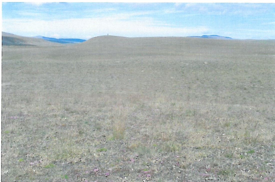
Mynd 3. Brú 27. júlí. Borið á 2003, 2004 og 2005.