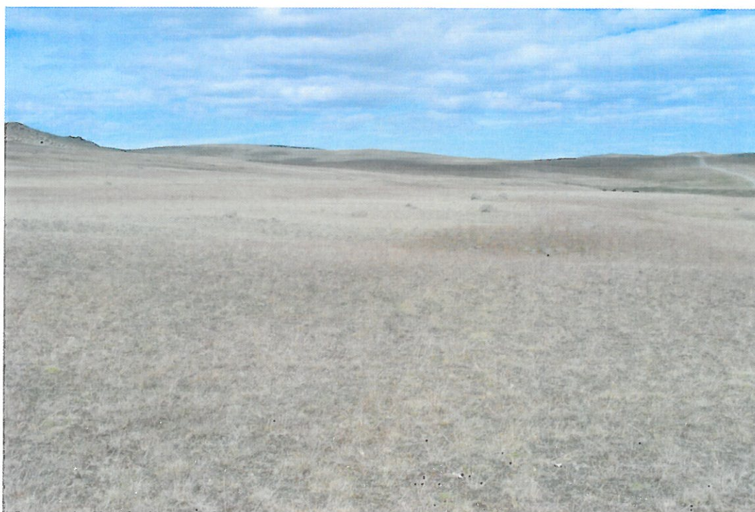
Mynd 4. Múli 27. júlí. Borið á 2003 og 2004.