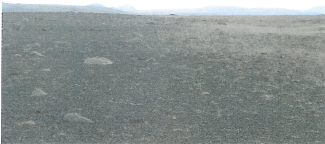
Mynd 2. Jaðar áburðardreifingar.