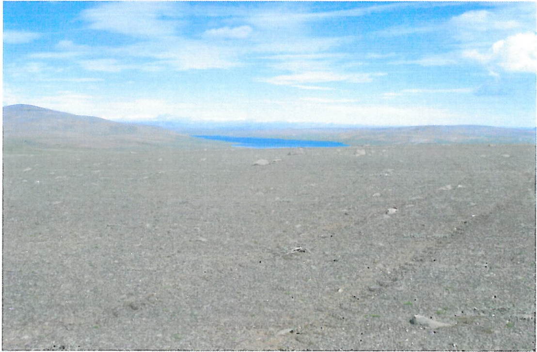
Mynd 1. Grunnavatnsalda 27. júlí. Borið á í fyrsta skipti 2005.