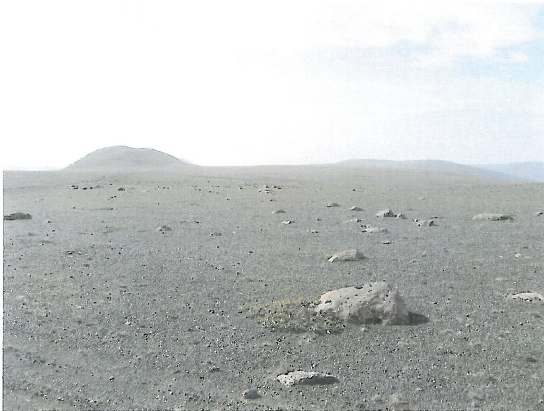
Mynd 1. Melur sem ekki hefur verið borið á.

Hér á eftir er fjallað um þau uppgræðslusvæði sem áætlað er að unnið verði á næstu árin, helstu einkenni þeirra og áherslur í starfinu. Nöfn svæða vísa til heita í töflu í Viðauka 1. Í flestum tilfellum er um að ræða gróðursnauða mela, oft með rofabörðum þar melar mæta grónu landi. Yfirborðsgerð er nokkuð mismunandi, sléttir melar með stöðugu yfirborði, grýttir melar, virk rofabörð og gróðurlendi með lausum fokefnum og virku rofi.